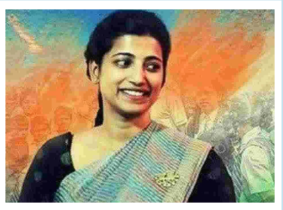
అమరావతి, అక్టోబర్ 27వ తేదీ వెలుగు న్యూస్