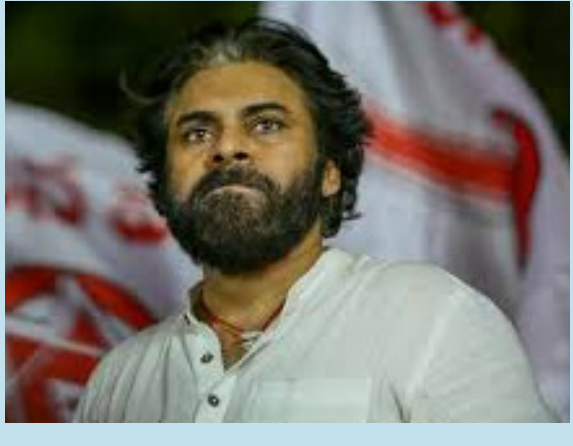
ప్రతి దశలోనూ తనిఖీలు చేస్తుండాలని ఆదేశాలు

పంచాయతీల్లో అభివృద్ధి పనులపై అధికారుల తనిఖీలు నేడు సమీక్ష నిర్వహించిన పవన్ కల్యాణ్ ఉపాధి హామీ పనుల నాణ్యతలో రాజీపడొద్దని అధికారులకు నిర్దేశం 5లో ప్రతి దశలోనూ తనిఖీలు చేస్తుండాలని ఆదేశాలు