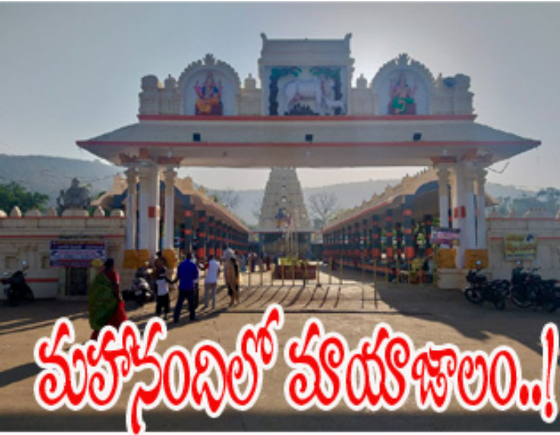
మహానంది. నవంబర్ 18 (పత్తి వెలుగు ప్రతినిధి)

ఆదోని పత్తి వెలుగు న్యూస్ : పత్తి ధర మరింత పతనమయింది. మార్కెట్ యార్డ్లో కేంద్ర ప్రభుత్వం ప్రకటించిన కనీస మద్దతు ధర కంటే క్వంటం పత్తి రూ.600 తక్కువకు వ్యాపారులు కొంటున్నారు. ఇలాంటి సమయంలో రైతులను ఆదుకోవాల్సిన ప్రభుత్వం రంగం సంస్థ కాటన్ కార్పొరేషన్ ఆఫ్ ఇండియా(సీసీఐ) నిబంధనల పేరుతో కాలయాపన చేస్తున్నది. ఎకరాకు మొదటి కోట్ 5 క్వంటాళ్లకు మించి కొనలేమని కరాఖండిగా చెప్పి వెనక్కి పంపిస్తున్నారు. మరోవైపు పత్తిలో తేమ ఉందని పేచి పెడుతున్నారు. నిబంధనల సుడిగుండంలో రైతులు పత్తి అమ్ముకోడానికి అవస్థ పడుతున్నారు. వ్యవసాయ, మార్కెటింగ్ శాఖ, సీసీఐ సమన్వయ లోపం పత్తి రైతులకు శాపంగా మారింది. -మిగతా2లో