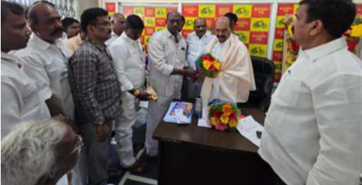
తెలిపారు. అలాగే గెలుపొందిన అధ్యక్షులు , ఉపాధ్యక్షులు , టీసీలు మంత్రివర్గులు ఎన్ఎండి ఫరూక్ , ఎన్ఎండి ఫిరోజ్ , ఎన్ఎండి ఫరూజ్ ప్రత్యేక ధన్యవాదాలు తెలియజేశారు