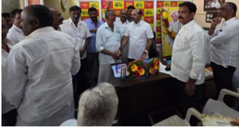
నంద్యాల ప్రతినది పల్లె వెలుగు డిసెంబర్:-15 నంద్యాల నియోజకవర్గంలో జరిగిన సాగునీటి సంఘం ఎన్నికల్లో తెలుగుదేశం పార్టీ మద్దతుదారులు టిడిపికి ఏకగ్రీవం అయ్యాయి. ఏకగ్రీవమైన అధ్యక్షులతో పాటు ఉపాధ్యక్షులను డైరెక్టర్లను ,