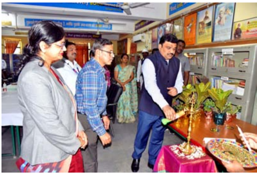
జిల్లా కలెక్టర్ పి.రంజిత్ బాషా.