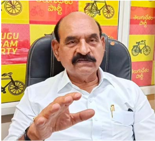
జిల్లా కేంద్రాల్లో ఉన్న మైనార్టీల సంక్షేమ/మైనారిటీల మైనార్టీ కార్యాలయాలలో మైనార్టీ యువత ఉచిత శిక్షణ పొందుతున్న తమ దరఖాస్తు ఫారాలను అందించాలని, ఈ అవకాశాన్ని సద్వినియోగం చేసుకోవాలని మంత్రి ఫరూక్ కోరారు.

అందించడం ద్వారా పారిశ్రామికవేత్తలు/స్వయం ఉపాధిని సృష్టించడానికి పరిశ్రమ ఆధారిత నైపుణ్యాలతో యువతకు సాధికారత కల్పించడానికి ప్రభుత్వం శ్రీ కృషి చేస్తున్నదని అన్నారు. ఇందులో భాగంగా సీడవ్ నిరుద్యోగ యువత కోసం వివిధ నైపుణ్య అభివృద్ధి కార్యక్రమాలను అమలు చేస్తోందని పేర్కొన్నారు. నైపుణ్యం కలిగిన యువతను అవసరమైన పరిశ్రమల యజమానులతో అనుసంధానించడం జరుగుతుందన్నారు. పరిశ్రమల అవసరాలకు సరిపోలని నైపుణ్యాలు ఉన్నవారికి, నాణ్యమైన రెసిడెన్షియల్ శిక్షణలను ఉచితంగా సీడవ్ అందించి స్కిల్ గ్యాప్ని భర్తీ చేస్తుందని తెలిపారు. ఉచిత శిక్షణలో రవాణా, కెరీర్ కౌన్సిలింగ్, యూనిఫాం, వసతి, ఆహారం, స్టడీ మెటీరియల్, ఉద్యోగ శిక్షణ ఇవ్వడం జరుగుతుందన్నారు. ఎన్ ఎన్ డి సి ద్వారా సర్టిఫికేషన్, ఉద్యోగ నియామకాలు, పోస్ట్ జాబ్ షేప్ మెంట్ కు మద్దతు కూడా ఉంటుందని తెలిపారు. రాష్ట్రంలో అన్ని