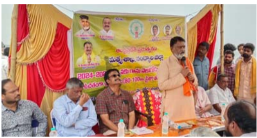
వెలుగోడు డిసెంబర్ 09 పల్లె వెలుగు

వెలుగోడు బ్యాలెస్టింగ్ రిజర్వాయర్ ( తెలుగు గంగ జలాశయంలో) 7.5 ( 7 లక్షల 50 వేల) చేప పిల్లలను శ్రీశైలం ఎమ్మెల్యే బుడ్డా రాజశేఖర్ రెడ్డి అధికారులు, ప్రజాప్రతినిధులతో కలిసి విడుదల చేశారు. సోమవారం ముందుగా గంగమ్మ తల్లికి ప్రత్యేక పూజలు నిర్వహించి వీర, సారాతో గంగమ్మ తల్లికి హారతినిచ్చారు. అనంతరం ఏర్పాటు చేసిన సమావేశంలో ఆయన మాట్లాడుతూ తెలుగు గంగ జలాశయంలో 20 లక్షల చేప పిల్లలను విడుదల చేయాలని అధికారులను చెప్పడం జరిగిందని