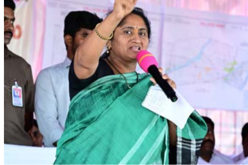
రెవెన్యూ సదస్సులు నిర్వహిస్తున్నారన్నారు. ప్రజలు తమ ప్రభుత్వంపై పెట్టుకున్న నమ్మకాన్ని నిలబెట్టుకునేలా పనిచేస్తున్నామన్నారు.