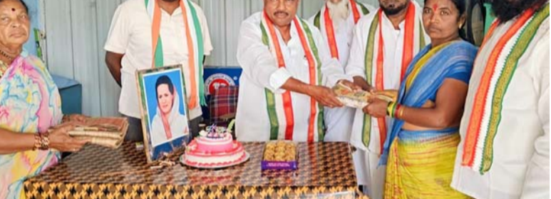
నంద్యాల ప్రతినిధి. డిసెంబర్ 09 . పల్లె వెలుగు : అఖిల భారత కాంగ్రెస్ కమిటీ