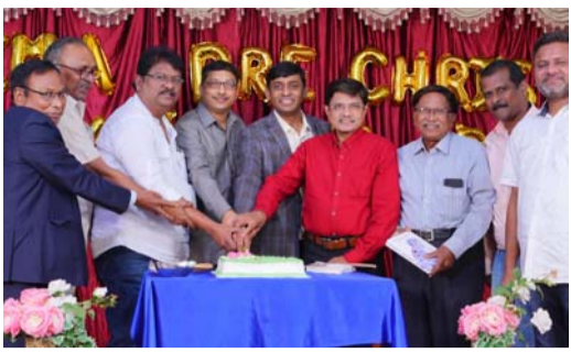
నంద్యాల ప్రతినిధి. డిసెంబర్ 09 . పల్లె వెలుగు