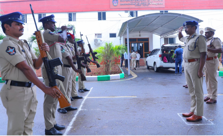
గుంటూరు చీఫ్ బ్యూరో డిసెంబర్ 3