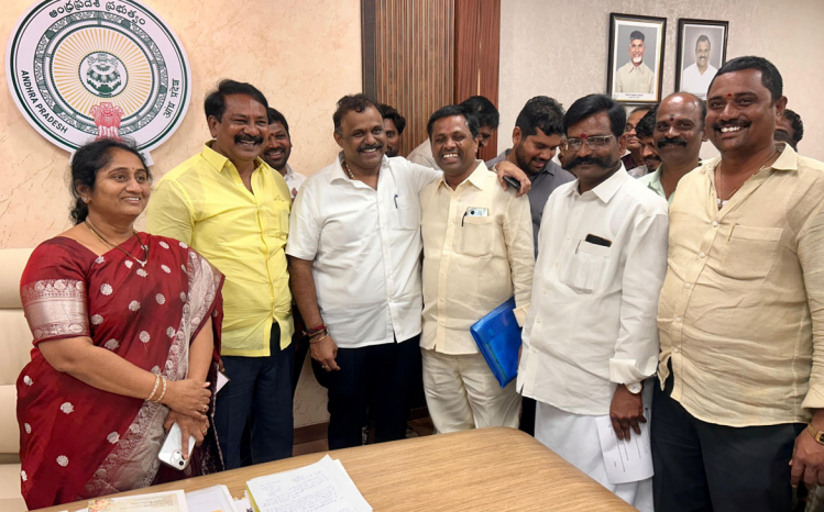
అమరావతి టీవీ బ్యూరో డిసెంబర్ 3