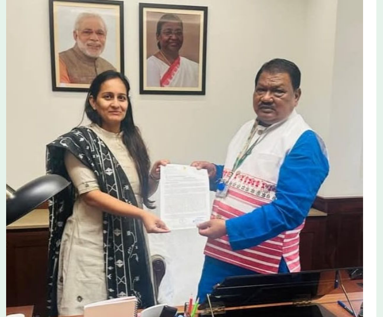
- ఎంపీ డాక్టర్ బైరెడ్డి శబరి.

సంద్యాల జిల్లా బ్యూరో :-న్యూఢిల్లీ డిసెంబర్ 04 సంద్యాల జిల్లా నల్లమల అరణ్యంలోని శ్రీశైలం, నందికొట్కూరు నియోజకవర్గాలలో ఉన్న చెంచు గూడెంలో గిరిజన చిన్నారులకు ( అడవి బిడ్డలకు ) ఏకలవ్య పాఠశాలలు ఏర్పాటు చేసి వారి చదువులను ప్రోత్సహించాలని కేంద్ర గిరిజన వ్యవహారాల మంత్రి జ్యూయల్ ఆరంసు సంద్యాల ఎంపీ డాక్టర్ బైరెడ్డి శబరి కోరారు. మంగళవారం ఢిల్లీలోని కేంద్ర గిరిజన వ్యవహారాల శాఖ మంత్రి కార్యాలయంలో కేంద్ర గిరిజన శాఖ మంత్రిని సంద్యాల ఎంపీ, లోక్ సభ డీపీఐ డిప్యూటీ ఛోసే రీడర్ డాక్టర్ బైరెడ్డి శబరి మర్యాదపూర్వకంగా కలిసారు. ఈ సందర్భంగా ఆమె మాట్లాడుతూ శ్రీశైలం, నందికొట్కూరు నియోజకవర్గాలలో "ఏకలవ్య పాఠశాల"లను ఏర్పాటు చేయాలని కోరుతూ ఆయనకు వినతి పత్రాన్ని అందజేయడం జరిగింది. "ఏకలవ్య పాఠశాలలు గిరిజన ప్రాంతాల్లో ఉన్న పిల్లలకు నాణ్యమైన విద్యను అందించడానికి ప్రవేశపెట్టారని, గిరిజన బిడ్డల విద్య, జీవన వైపునాళ్లు అభివృద్ధిపై ఏకలవ్య పాఠశాలలు దృష్టి సారినారు.