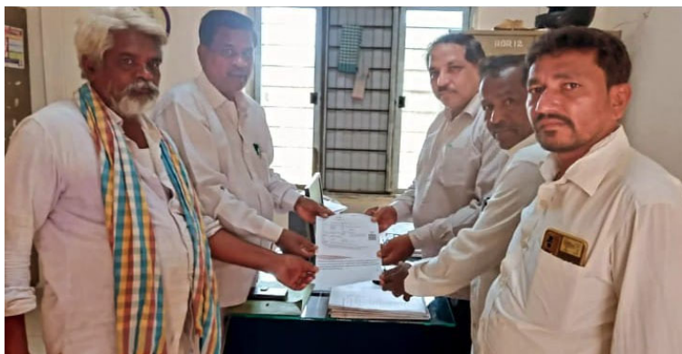
పాములపాడు డిసెంబర్ 3