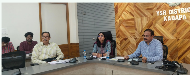
-జిల్లా కలెక్టర్ డాక్టర్ శ్రీధర్ చెరుకూరి