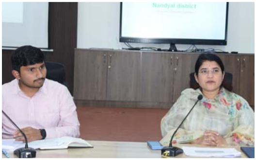
-గిరిజనుల అభివృద్ధిపై ప్రత్యేక శ్రద్ధ పట్టండి -జిల్లా కలెక్టర్ రాజకుమారి గణియా

నంద్యాల జ్యూరీ. డిసెంబర్ 26 . పల్లె వెలుగు ):జిల్లాలోని గిరిజన ప్రాంతాల్లోని గిరిజనుల జీవన ప్రమాణాలు మెరుగుపరచేందుకు సంబంధిత అధికారులు ప్రత్యేక శ్రద్ధ తీసుకోవాలని జిల్లా కలెక్టర్ జి.రాజకుమారి అన్నారు. గురువారం కలెక్టరేట్లోని వీడియో కాన్ఫరెన్స్ హాల్లో జిల్లా గిరిజన అభివృద్ధి ఉప ప్రణాళిక పై సంబంధిత అధికారులతో సమీక్ష నిర్వహించారు. ఈ సందర్భంగా జిల్లా కలెక్టర్ జి.రాజకుమారి మాట్లాడుతూ జిల్లాలో 14 మండలాల్లోని 48 చెంచుగూడెంలలో నివాసం ఉంటున్న దాదాపు 53,000 మంది జీవన ప్రమాణాలు మెరుగుపరచేందుకు సంబంధిత అధికారులు ప్రత్యేక శ్రద్ధతో మనసు పెట్టి కృషి చేయాలన్నారు. గిరిజన ఉప ప్రణాళిక కింద కేటాయించిన నిధులు, సంబంధిత పనుల ప్రగతి నివేదికలను కలెక్టర్ పరిశీలిస్తూ సంబంధిత అధికారుల నుండి వివరాలు అడిగి తెలుసుకున్నారు. 2024-25 ఆర్థిక సంవత్సరానికి గిరిజన ఉప