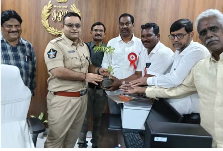
-జిల్లా ప్రజలకు ధన్యవాదాలు తెలియజేసిన రెడ్ క్రాస్

నంద్యాల ప్రతినిధి, జనవరి 01. ( పల్లె వెలుగు ): గత రెండు సంవత్సరాలుగా రెడ్ క్రాస్ ఆధ్వర్యంలో పర్యావరణాన్ని పచ్చదనాన్ని కాపాడుకుంటూ, మొక్కలతో, విద్యాసామాగ్రితో నూతన సంవత్సర వేడుకలు జరుపుకుంటుంది అనే ఆశయంతో ప్రజలలో బోకేలు కేకులు దండలు కాకుండా మొక్కల ద్వారా వేడుకలు జరుపుకోవడానికి అవగాహన