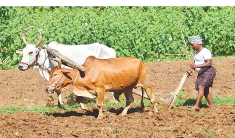
జిల్లాలో 2.30 లక్షల మంది రైతులకు లబ్ధి రూ.1350కో డీపీపీ బహు యూనిక్ నెంబరుతో గుర్తింపు కార్డులు

నరసన్నపేట, జనవరి 2 రైతుల సంక్షేమమే లక్ష్యంగా కేంద్ర, రాష్ట్ర ప్రభుత్వాలు పాలన సాగిస్తున్నాయి. అన్నదాతకు అండగా ఉండేలా.. కేంద్రమంత్రి మండలి పలు నిర్ణయాలకు ఆమోదం తెలిపింది. రైతులకు వరాల జల్లు కురిపించింది. ప్రధాన మంత్రి ఫసల్ బీమా యోజన పథకం కింద ఏటాకు రైతులకు అందిస్తున్న సాయాన్ని రూ.6వేల నుంచి రూ.10వేలకు పెంచింది. 2019 నుంచి కేంద్ర ప్రభుత్వం ఏటా రైతులకు మూడు విడతల్లో రైతులకు రూ.6వేల పెట్టుబడి సాయాన్ని అందిస్తోంది. కేంద్రమంత్రి మండలి ఆమోదం మేరకు ఇక వచ్చే ఏప్రిల్ నుంచి నాలుగు విడతల్లో రూ.2,500 చొప్పున రైతుల ఖాతాల్లో మొత్తం రూ.10వేలు జమ చేయనున్నారు. జిల్లాలో 2.30 లక్షల మంది రైతులకు