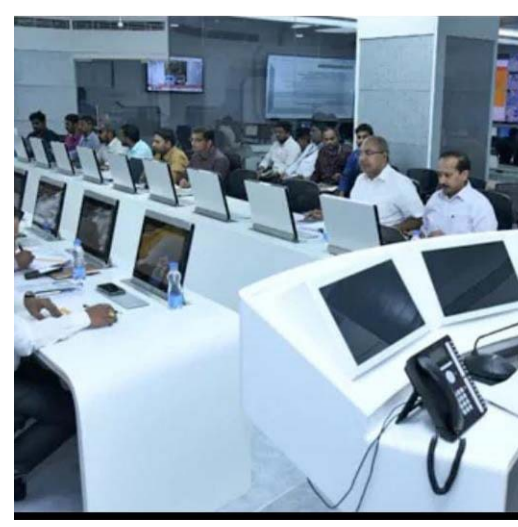
మంత్రులతో రాష్ట్ర ముఖ్యమంత్రి చంద్రబాబునాయుడు కీలక భేటీ

అమరావతి చీఫ్ జ్యూజ్ జనవరి రెండు పల్లె వెలుగు ఈ ఏడాది తల్లికి వందసం, రైతులకు 20 వేల ఆర్థిక సాయం, మత్స్యకారులకు 20 వేల ఆర్థిక సాయం అందించే విషయాలపై మంత్రులతో చర్చ ఈనెల 8న విశాఖలో జరగనున్న ప్రధానమంత్రి మోడీ రోడ్ షో విజయవంతం చేసేందుకు ఉప మంత్రివర్గం తో కమిటీ మంత్రివర్గ సమావేశం అనంతరం పాలన అంశాలపై మంత్రులతో సీఎం చంద్రబాబు నాయుడు కాసేపు ముచ్చటించారు కొత్త విధానంలో అమలు చేయాలన్న వివిధ పథకాలపై చర్చించారు వచ్చే విద్యా సంవత్సరం నుంచి తల్లికి వందసం అమలుతోపాటు రైతులకు మత్స్యకారులకు ఇచ్చే 20 వేల రూపాయలు ఆర్థిక సాయం పైన చర్చించారు, రాష్ట్ర కేంద్రం ఇచ్చే ఆర్థిక సాయంతో పాటు 20 వేల రూపాయల రాష్ట్ర ప్రభుత్వ సాయం కూడా కలిపి ఒకేసారి అంశంపై చర్చించారు వేట నిలిచిపోయిన సమయంలో మత్స్యకారులకు అందించే 20వేల రూపాయల సాయం పైన చర్చించారు, రాష్ట్ర ప్రభుత్వం అమలు చేస్తున్న సంక్షేమ పథకాలు అభివృద్ధిని ప్రజలకి తీసుకెళ్లే బాధ్యత మంత్రులు తీసుకోవాలని ఈనెల 8న విశాఖపట్టణంలో జరగనున్న ప్రధాని మోడీ రోడ్ షో విజయవంతం చేసేందుకు మంత్రులతో క్యాబినెట్ సబ్ కమిటీ వేయాలని నిర్యాయించారు