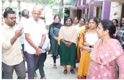
పడ్డారని అన్నారు. ఈ లిఫ్ట్ ను పరిశీలించాలని, త్వరగా మరమ్మత్తులు చేయించాలని అధికారులను ఆదేశించామని అన్నారు.

సంస్థ కార్యాలయం సమీపంలో గల మెప్పా కార్యాలయం, అగ్నిమాపక కేంద్రం, క్రైమ్ ఇన్వెస్టిగేషన్ లాభా వద్ద గల మహిళా మార్ట్ ను గురువారం మధ్యాహ్నం కమిషనర్ ఆకస్మికంగా తనిఖీ చేశారు. మెప్పా కార్యాలయం వద్ద అపరిశుభ్రత, మహిళా మార్ట్ వద్ద లిఫ్ట్ మరమ్మత్తులు చేయకపోవడం పట్ల సిబ్బందిపై ఆగ్రహం వ్యక్తం చేశారు. ఈ సందర్భంగా కమిషనర్ మాట్లాడుతూ మెప్పా కార్యాలయం కు పెద్ద సంఖ్యలో మహిళలు వస్తుంటారని, వారికి మౌలిక వసతులు కల్పించాలని కోరారని అన్నారు. ఈ మేరకు తనిఖీ చేశామని అన్నారు. మహిళల కోసం ప్రత్యేకంగా మరుగుదొడ్లు ఏర్పాటు చేయాలని ఇంజనీరింగ్ అధికారులను ఆదేశించామన్నారు. అలాగే చుట్టూ ఉన్న పిచ్చిమొక్కలు తొలగించి పరిసరాలను ఉంచుకోవాలి సూచించామని అన్నారు. మహిళా మార్ట్ వద్ద లిఫ్ట్ మరమ్మత్తులకు గురి కావడంతో ప్రజలు ఇబ్బంది