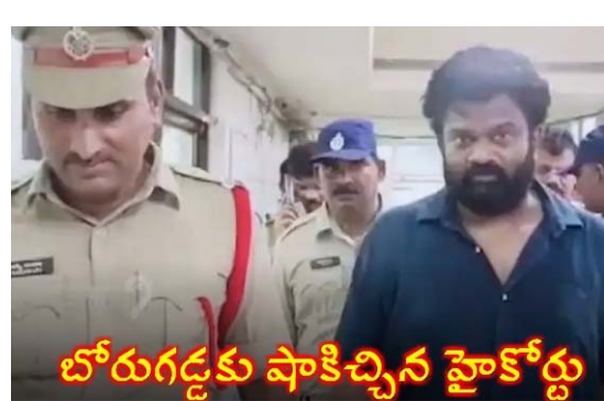
బోరుగడ్డకు షాకిచ్చిన హైకోర్టు

బోరుగడ్డకు షాకిచ్చిన హైకోర్టు.. అసభ్యకరమైన పోస్టులు పెట్టడమే పనిగా పెట్టుకున్నారా.. అంటూ సీరియస్ ఇలాంటి వారిని క్షమించడానిక 2లో వీలేదని తేల్చిచెప్పిన జడ్జి సోషల్ మీడియా పోస్టుల వ్యవహారంపై అనంతపురంలో బోరుగడ్డపై కేసు