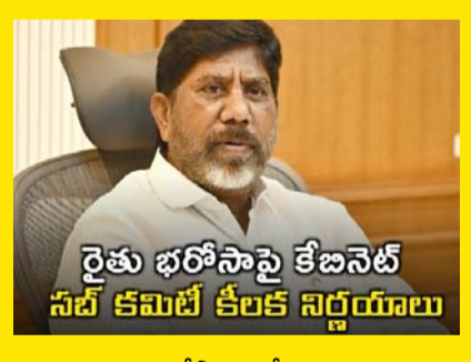
రైతు భరోసాపై కేబినెట్ సబ్ కమిటీ కీలక నిర్ణయాలు

సాగు చేసే ప్రతి రైతుకు రైతు భరోసా ఇవ్వాలని నిరాయం బటి చెల్లింపు, భూమి పరిమితిని పెట్టవద్దని అభిప్రాయపడిన కమిటీ రైతుల నుంచి దరఖాస్తులు తీసుకోవాలని నిరాయం