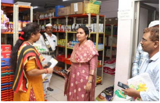
మహిళా మార్ట్ లిఫ్ట్ మరమ్మత్తులు చేపట్టండి. కమిషనర్ ఎన్.మౌర్య

తిరుపతి చీఫ్ బ్యూరో జనవరి 2 పల్లె వెలుగు నగరంలోని మహిళలకు అండగా ఉన్న పట్టణ పేదరిక నిర్మూలన కేంద్రం (మెప్పా) లో మరుగుదొడ్లు ఏర్పాటు చేయాలని నగరపాలక సంస్థ కమిషనర్ ఎన్.మౌర్య అధికారులను ఆదేశించారు. నగరపాలక