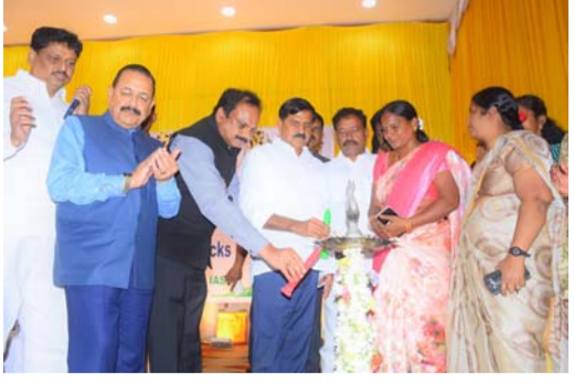
మోరగుడి సభలో కేంద్ర శాస్త్ర సాంకేతిక, భౌగోళిక శాస్త్ర శాఖమంత్రి డా. జితేంద్ర సింగ్