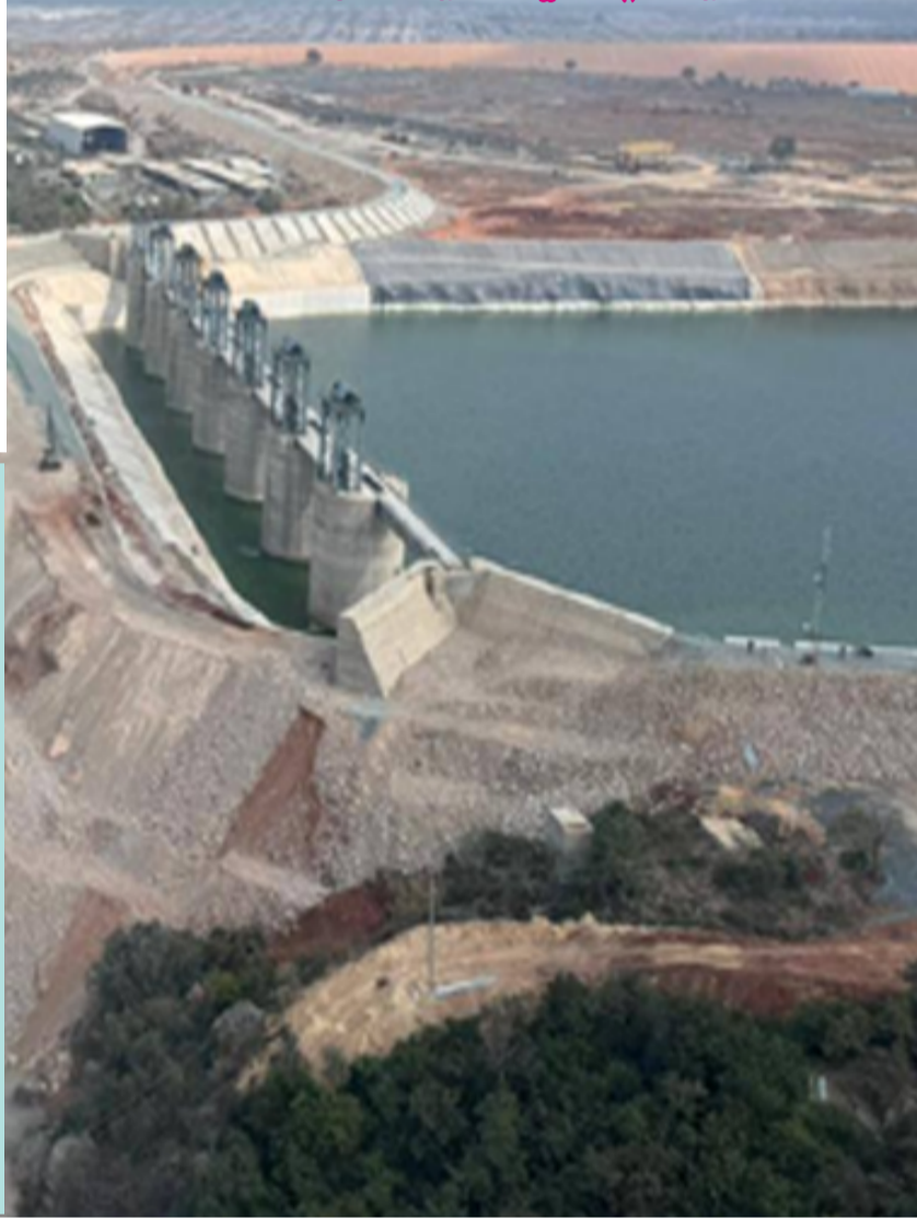
కర్నూలు పల్లె వెలుగు

కర్నూలు జిల్లా ఓర్వకల్లులో గ్రీన్ కో సోలార్ పార్క్ ప్రాజెక్టును సందర్శించిన పవన్ కల్యాణ్ తొలుత ఏరియల్ వ్యూ... తర్వాత రోడ్డు మార్గం ద్వారా పరిశీలన