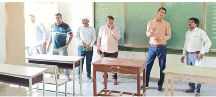
ఐదు నిమిషాలు ఆలస్యమైన అనుమతిస్తారని అధికారులు సూచించారు.