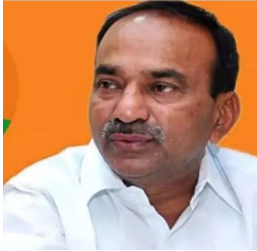
గెలుపొందడమే కాకుండా వైయస్ రాజశేఖర్ రెడ్డి హయాంలో తెలంగాణ గానూ వినబించి, తెలంగాణ ఉద్యమంలో కీలక

కమలం పార్టీ నేడే, రేపా తెలంగాణ బీజేపీ పార్టీ స్టేట్ చీఫ్ ను ప్రకటించనున్నట్లు వస్తున్న నేపథ్యంలో మల్లాజిరి ఎంపీ ఈటల రాజేందర్ కు బీజేపీ పార్టీ పగ్గాలు వస్తున్నాయంటూ ఇటు సోషల్ మీడియాలో, అటు అభిమానుల వాట్సాప్ గ్రూప్స్ లో బీజేపీ పార్టీ రాష్ట్ర అధ్యక్షుడు ఈటల అన్నట్లుగా బలం చేకూరుస్తున్నాయి. ఈరోజు ఈటల పుట్టినరోజు సందర్భంగా కాసుకగా ఇస్తున్నారనే ప్రచారం భాగంగా జోరుగా సాగుతుంది. ఈటల పుట్టినరోజు సందర్భంగా కేంద్ర ప్రభుత్వం ఈటలకు రాష్ట్ర బీజేపీ చీఫ్ గా కాసుకగా ఇవ్వనుందా ? అంటూ హాసమకొంద జిల్లా కమలాపూర్ మండలం, హుజూరాబాద్ నియోజకవర్గంలో కాకుండా రాష్ట్రవ్యాప్తంగా ఉన్న బీజేపీ పార్టీ శ్రేణుల్లో, ఈటల అభిమానులు ఇప్పటికే హైదరాబాద్ షామీర్సాట్ లోని ఈటల నివాసానికి పెద్ద ఎత్తున అభిమానులు చేరుతున్నట్లు సమాచారం. హుజూరాబాద్ లో ఇప్పటికే విడుదలైన అసెంబ్లీకి మెజారిటీతో గెలిచి వెళ్లి ఇప్పుడు మల్లాజిరిరి ఎంపీగా